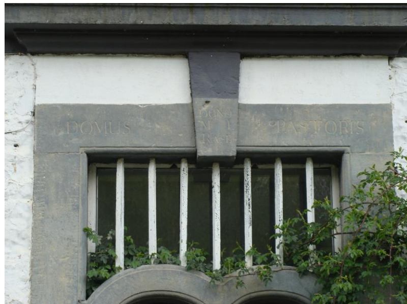
L'inscription « Domus pastoris » se devine dans la pierre.